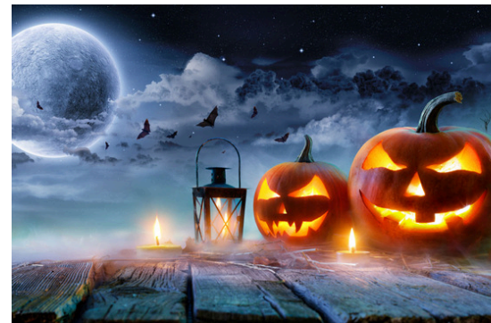
A Halloween on voit toujours des citrouilles

Les Celtes célébraient la fête de Samain, fin octobre. Ils pensaient qu'au cours de cette nuit, les frontières entre le monde des morts et celui des vivants étaient ouvertes et ils revêtaient des costumes effrayants pour éloigner les mauvais esprits.