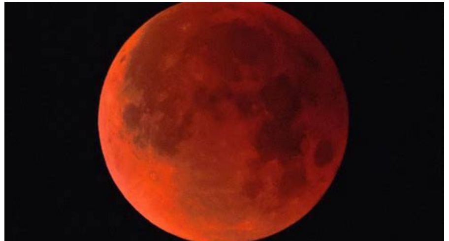
La lune bleue, en effet elle est rouge !!

Le terme "bleu" ne veut pas dire que la lune prenne une teinte particulière lors du phénomène. Ce n'est pas un terme scientifique mais une transcription d'un terme anglais populaire.