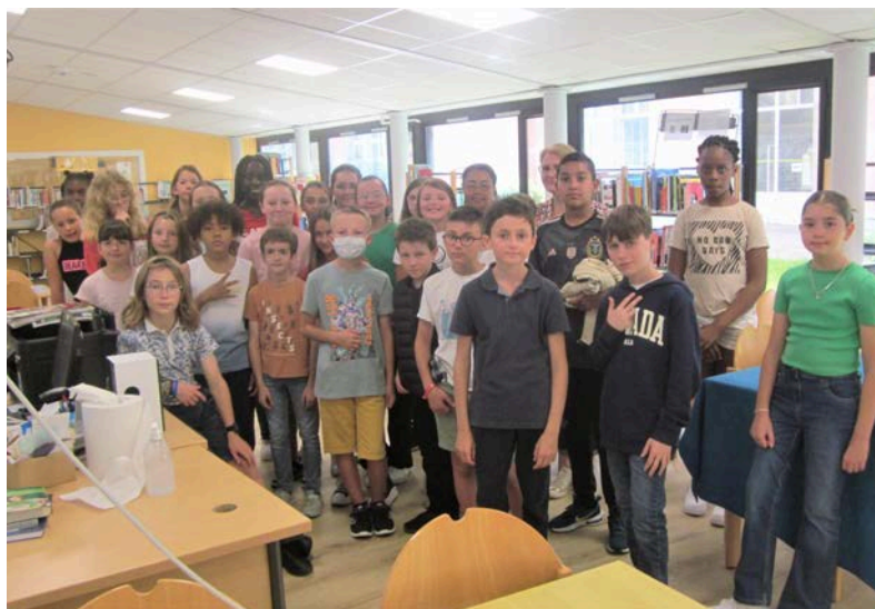
La classe de 6°1 en visite au CDI