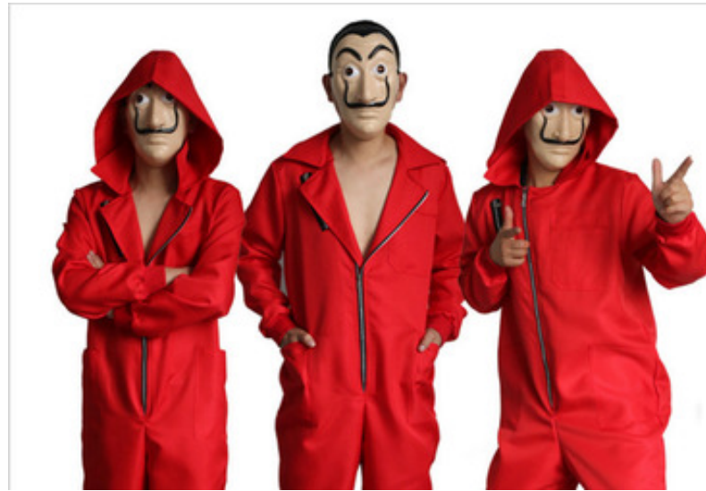
CASA DEL PAPEL