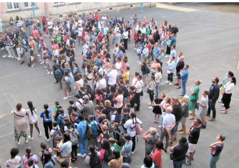
Les élèves de 6° et leurs familles.