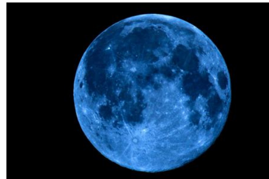
ceci est ce que représente une lune bleue pour nous

On peut donner différents noms à la lune rouge, tels que Lune bleue Lune rousse, ou encore Lune de sang, quoique celui-ci est moins utilisé.