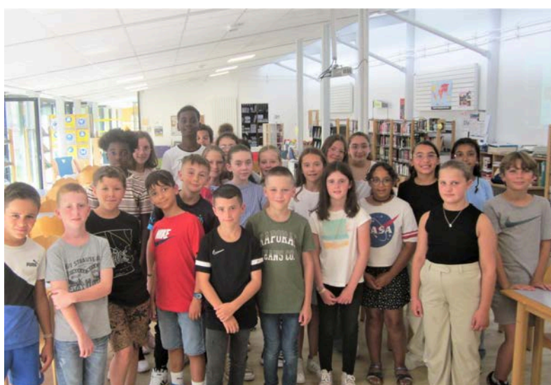
et les 6°5